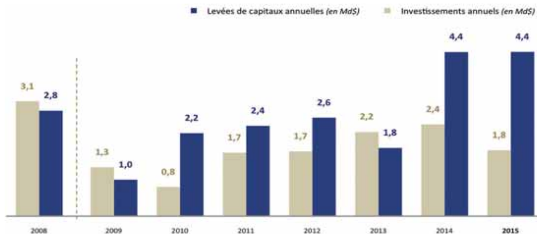
Levées et investissements du capital-investissement

stratégies et tailles sont plus compatibles avec les objectifs de financement des PME.